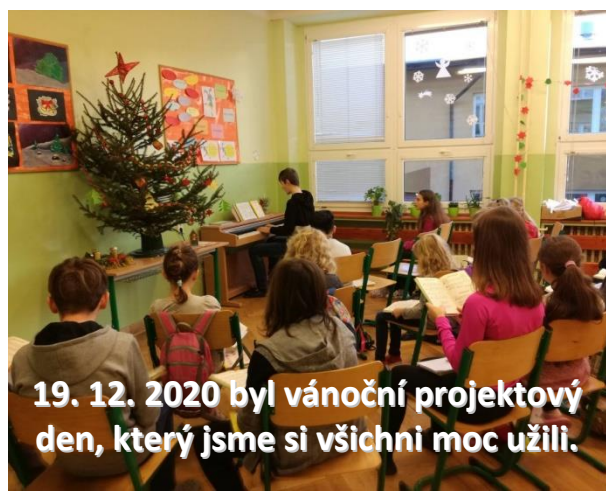
19. 12. 2020 byl vánoční projektový den, který jsme si všichni moc užili.