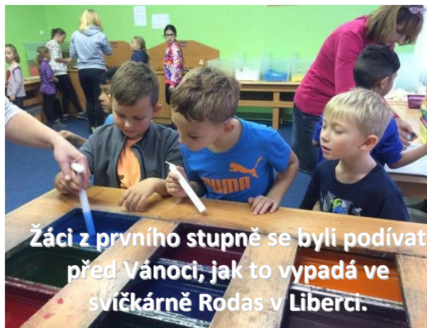
Žáci z prvního stupně se byli podívat před Vánoci, jak to vypadá ve svíčkárně Rodas v Liberci.