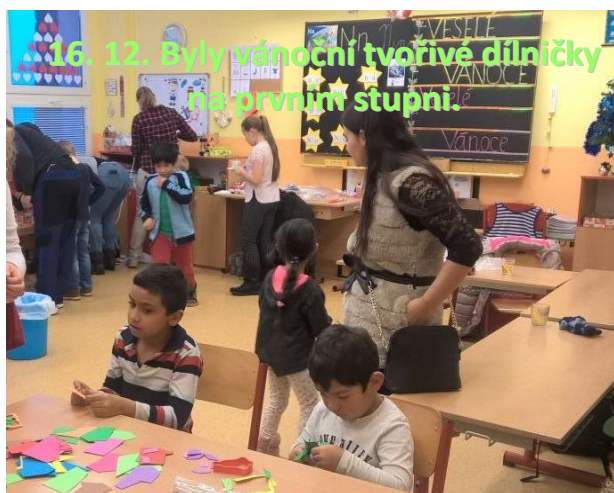
16. 12. Byly vánoční tvořivé dílničky na prvním stupni.