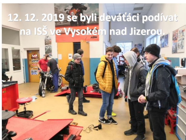
12. 12. 2019 se byli deváťáci podívat na ISŠ ve Vysokém nad Jizerou.