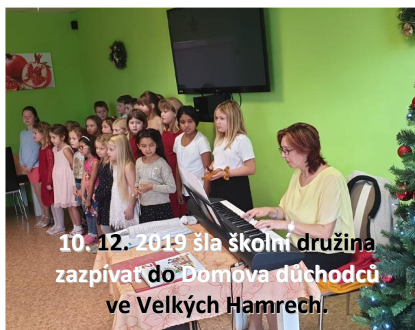
10. 12. 2019 šla školní družina zapívat do Domova důchodců ve Velkých Hamrech.