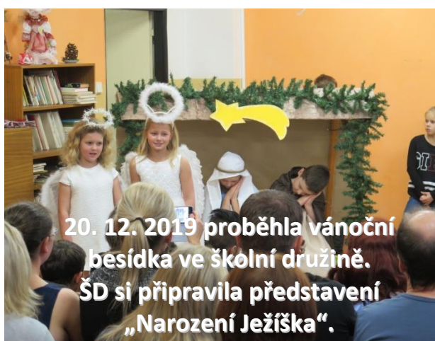
20. 12. 2019 proběhla vánoční besídka ve školní družině. ŠD si připravila představení „Narození Ježíška“.