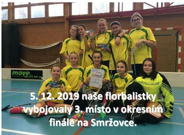
5. 12. 2019 naše florbalistky vybojovaly 3. místo v okresním finále na Smržovce.