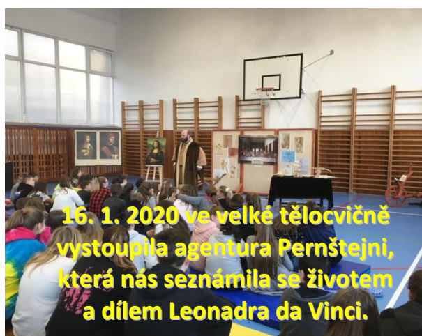
16. 1. 2020 ve velké tělocvičně vystoupila agentura Pernštejni, která nás seznámila se životem a dílem Leonadra da Vinci.