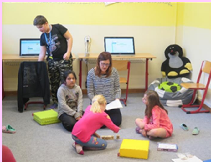
Podpora dětí školní speciální pedagožkou