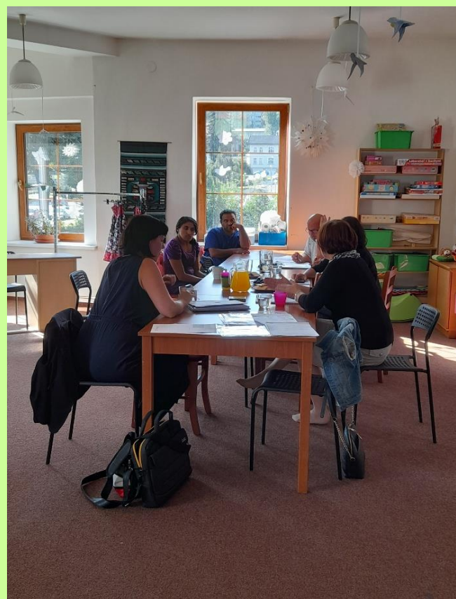
Workshop pro rodiče pro rodiče zejména žáků ze socioekonomicky znevýhodněného a kulturně odlišného prostředí o důležitosti vzdělávání, 8. 9. 2020, komunitní centrum ve Velkých Hamrech

CZ.02.3.61/0.0/0.0/19_075/0016959 je spolufinancován Evropskou unií. Škola ho realizuje jako partner Města Velké Hamry v termínu od 1. 8. 2020 do 31. 12. 2022.