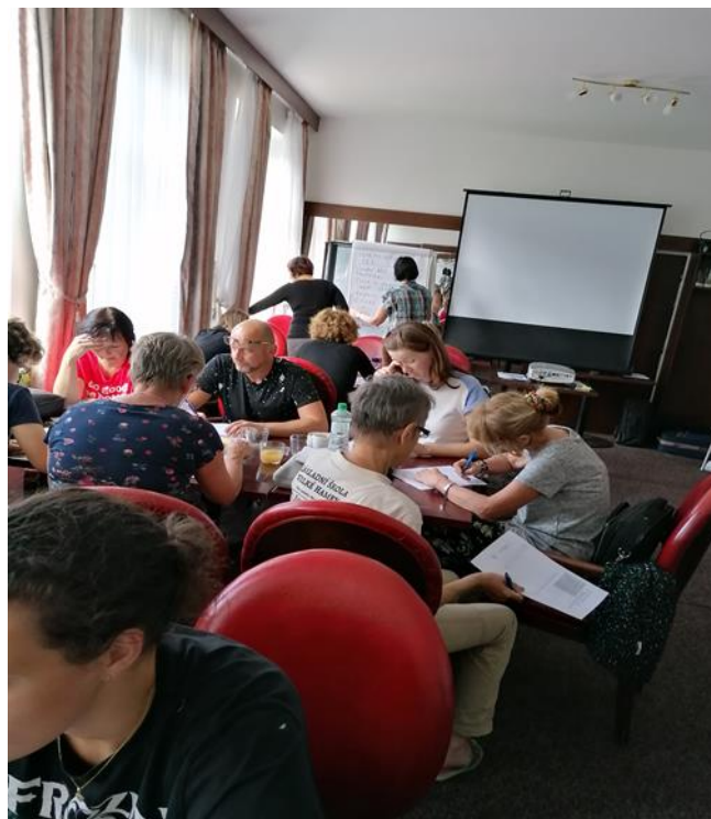
Foto: společné plánování, tvorba ročních tematických plánů; závěrečná reflexe