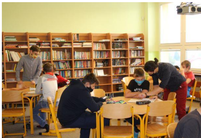
Spolupráce učitele a asistentky při čtenářských dílnách

Naše škola se připojila ke kampani společnosti ČOSIV "Dítě není diagnóza". Vyjádření vedení i pedagogů přikládáme.